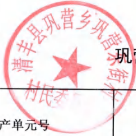
巩营乡巩营东街村房地一体不动产登记颁证信息审核表