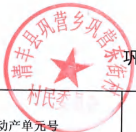
巩营乡巩营东街村房地一体不动产登记颁证信息审核表