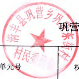
巩营乡巩营东街村房地一体不动产登记颁证信息审核表