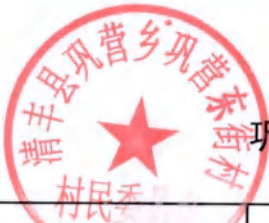
巩营乡巩营东街村房地一体不动产登记颁证信息审核表