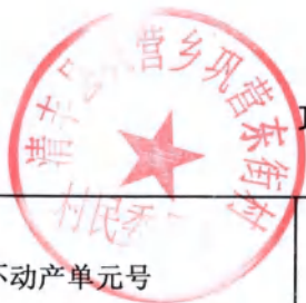
巩营乡巩营东街村房地一体不动产登记颁证信息审核表