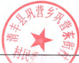
巩营乡巩营东街村房地一体不动产登记颁证信息审核表