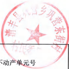
巩营乡巩营东街村房地一体不动产登记颁证信息审核表